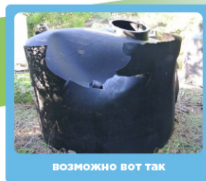
возможно вот так